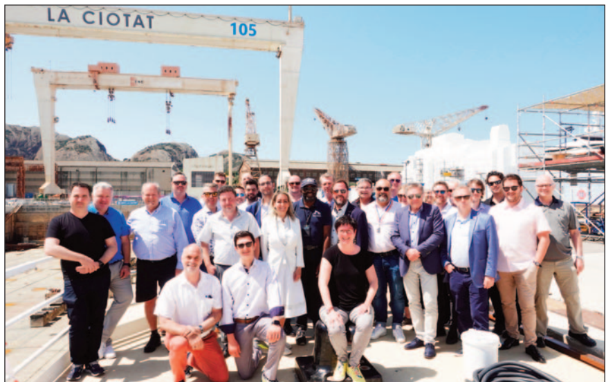
Visite de la délégation québécoise à La Ciotat Shipyards.