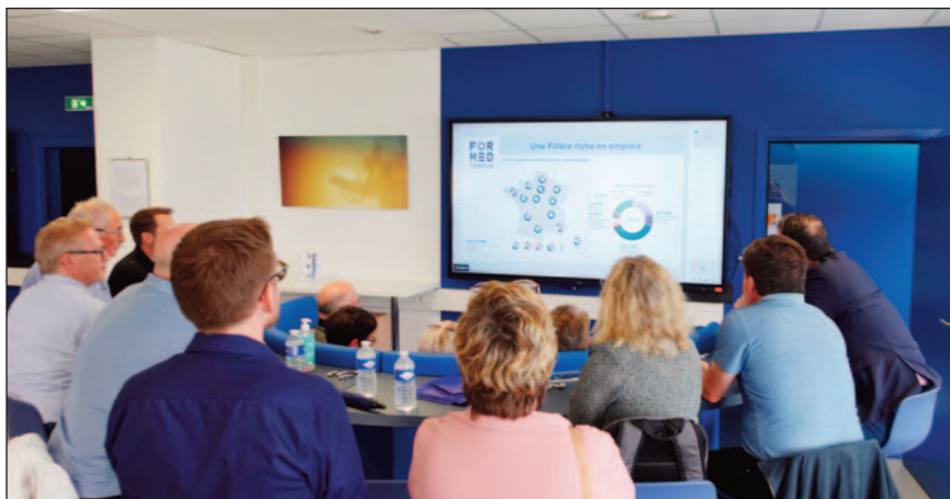
Présentation des activités du Campus des Métiers et des Qualifications d'Excellence (CMQE) Économie de la Mer (Université de Toulon).