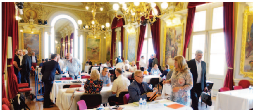
Rencontres B2B à l'Opéra de Toulon entre la délégation québécoise et des entreprises françaises.