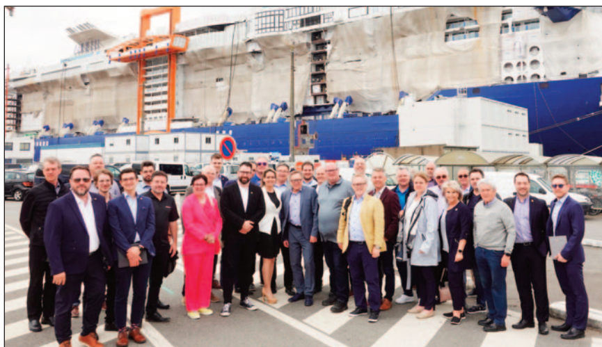
Arrivée de la délégation québécoise pour la visite aux Chantiers de l'Atlantique Saint-Nazaire.